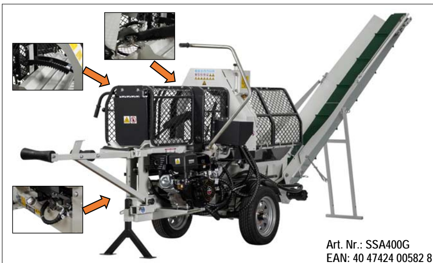
Art. Nr.: SSA400G EAN: 40 47424 00582 8