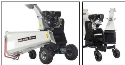
Klappbarer Einfüll- und Auswurftrichter