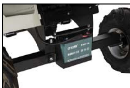
Batterie für Elektrostart