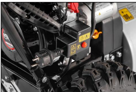
E-Start mittels 230V Stecker