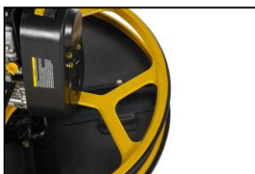
Disk Ø 790 mm