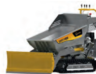
Art. Nr. 5VH500PROASS EAN: 40 47424 00999 4 Schneeräumschild f. VH500PROA

Die jahrelange Erfahrung und Entwicklung in Deutschland ermöglicht uns einige Vorteile gegenüber vergleichbaren Produkte. Hier können wir Ihnen die neuesten Modelle unserer vollhydraulischen Mini-Dumper anbieten. Diese gibt es in 3 verschiedenen Motorvarianten. Details der in Deutschland entwickelten Maschinen entnehmen Sie der übersichtlichen Darstellung oben.