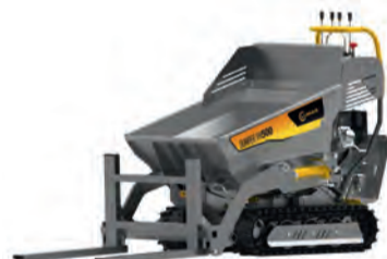
Art. Nr. 5VH500PROAPG EAN: 40 47424 00722 8 Palettengabel f. VH500PROA

Optionales Zubehör: (Abbildungen zeigen Vorgängermodell VH500)